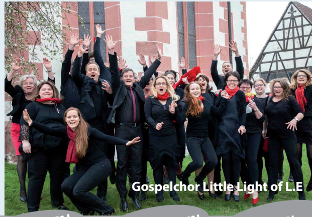
Gospelchor Little Light of L.E